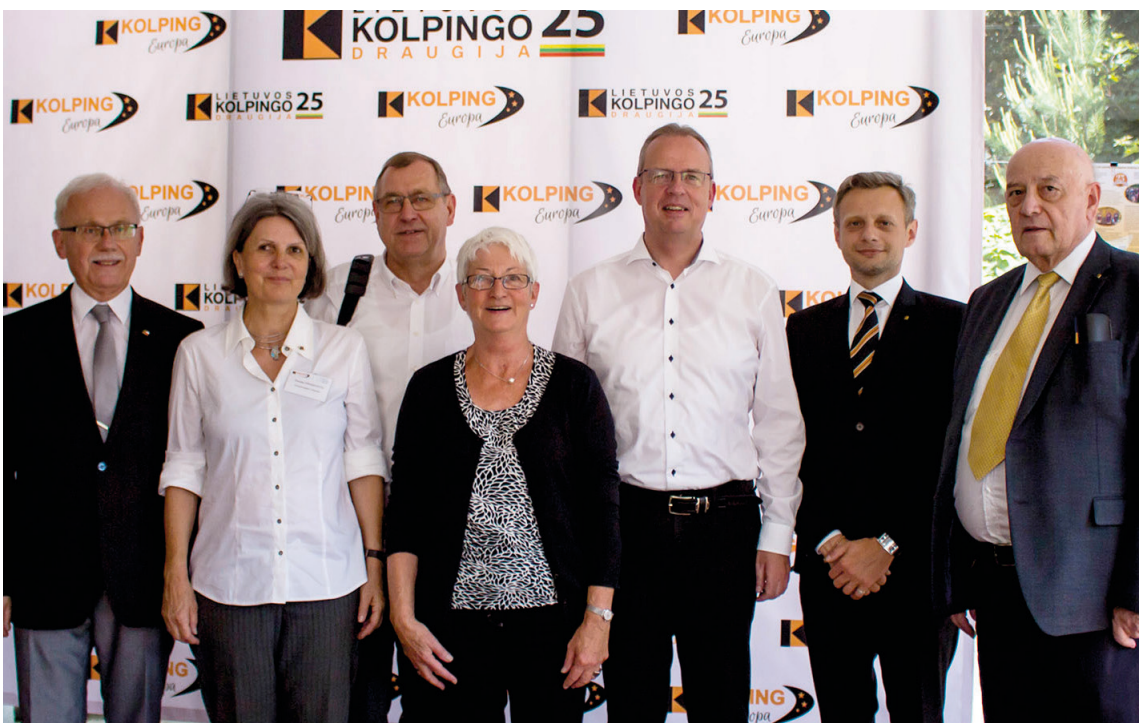
Der Kolping-Kontinentalvorstand 2018 in Litauen.

Und letztlich dürfen wir als Christen nicht von allen Staatsbürgern erwarten, dass sie ihr Glaubensleben in besonderer Weise pflegen. Denn wir haben Glaubens- und Religionsfreiheit. Aber wir als Christen, die mit der Auferstehung Jesu Christi den Kernpunkt unseres Lebens erblicken, müssen auch in Europa in besonderer Weise unser Glaubensleben pflegen. Zugleich müssen wir als Christen und auch als katholischer Sozialverband die EU und die Vertreter der EU immer wieder anmahnen, für das einzustehen, was sie sich selbst geschrieben haben: Frieden und Freiheit, ökologische und soziale Gerechtigkeit. Wir selbst müssen zugleich auch einstehen für Barmherzigkeit und Sanftmut, für Familie und unseren Glauben.