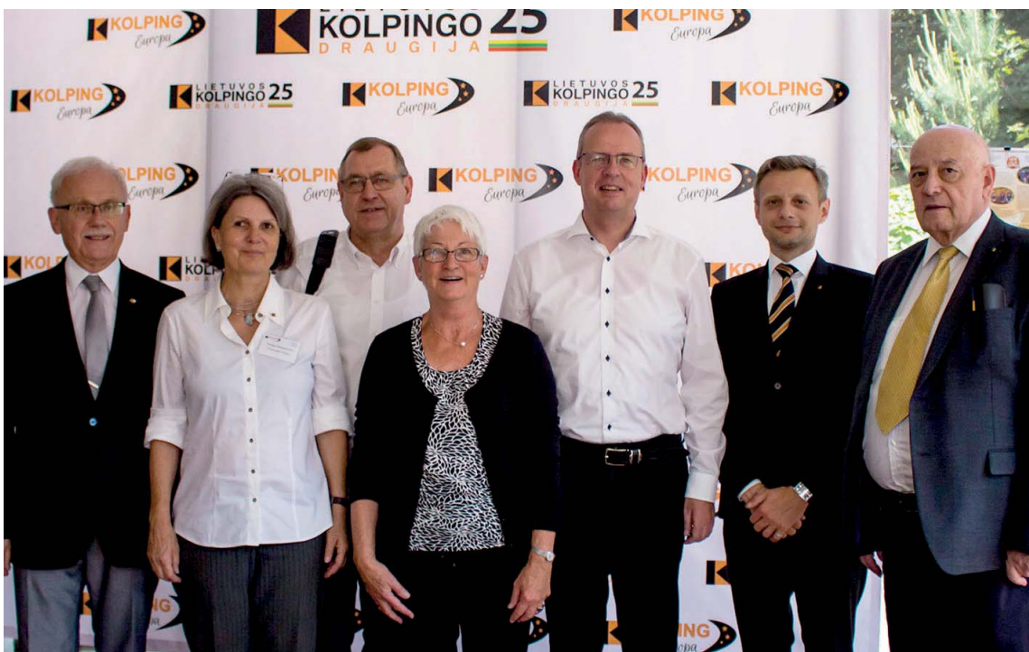
Der Kolping-Kontinentalvorstand 2018 in Litauen.

Und letztlich dürfen wir als Christen nicht von allen Staatsbürgern erwarten, dass sie ihr Glaubensleben in besonderer Weise pflegen. Denn wir haben Glaubens- und Religionsfreiheit. Aber wir als Christen, die mit der Auferstehung Jesu Christi den Kernpunkt unseres Lebens erblicken, müssen auch in Europa in besonderer Weise unser Glaubensleben pflegen. Zugleich müssen wir als Christen und auch als katholischer Sozialverband die EU und die Vertreter der EU immer wieder anmahnen, für das einzustehen, was sie sich selbst geschrieben haben: Frieden und Freiheit, ökologische und soziale Gerechtigkeit. Wir selbst müssen zugleich auch einstehen für Barmherzigkeit und Sanftmut, für Familie und unseren Glauben.